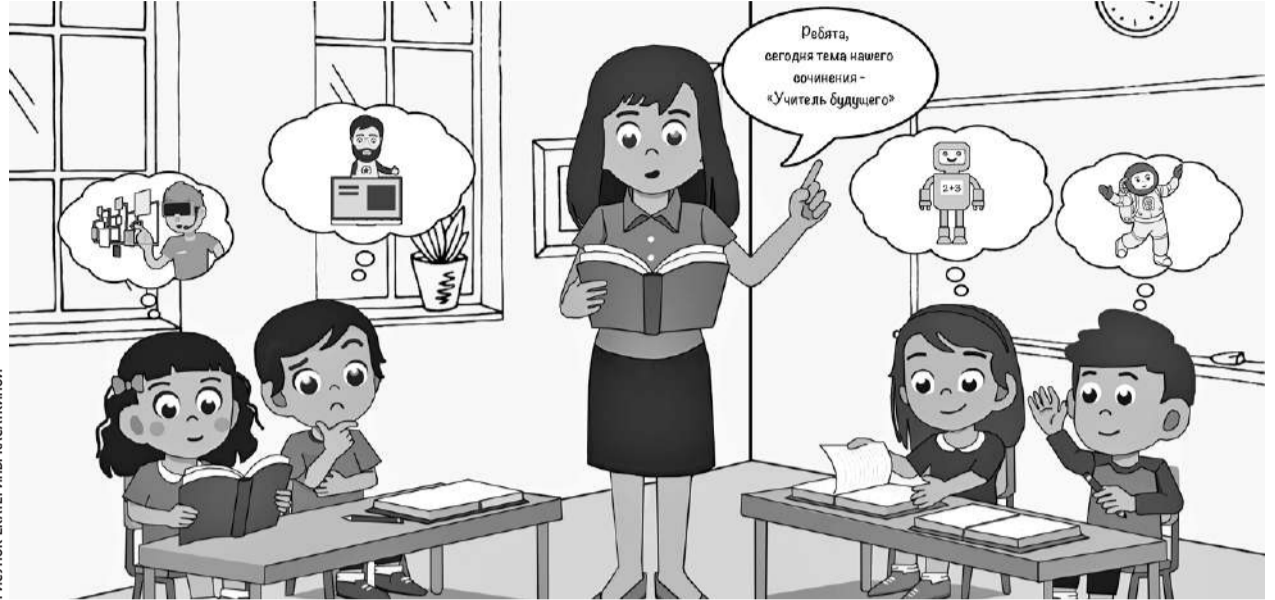
РИСУНОК ЕКАТЕРИНЫ КАСАКИНОЙ

Общая сумма выделенных средств — 10 млн рублей. Из них федеральное финансирование — около 8,5 млн. Почти 1,4 млн —