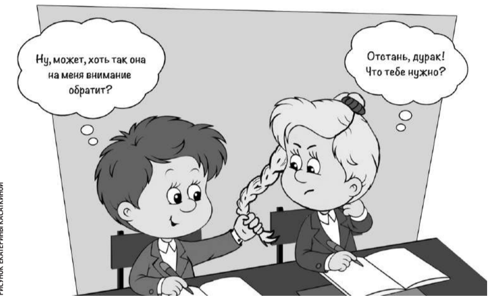
РИСУНОК ЕКАТЕРИНЫ КАСАКИНОЙ

Наши подростки переживают чувства влюблённости, первой любви, дружбы — это прекрасные человеческие чувства и отношения,